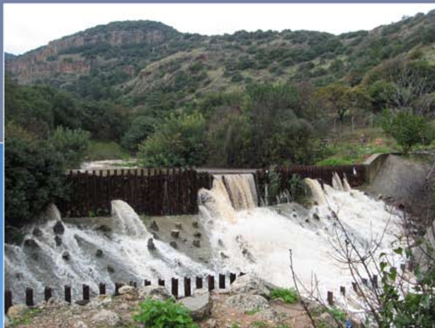
הסכר - וואדי יגור