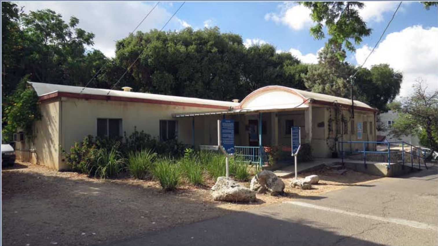
מבנה ה"איזולטור" הישן