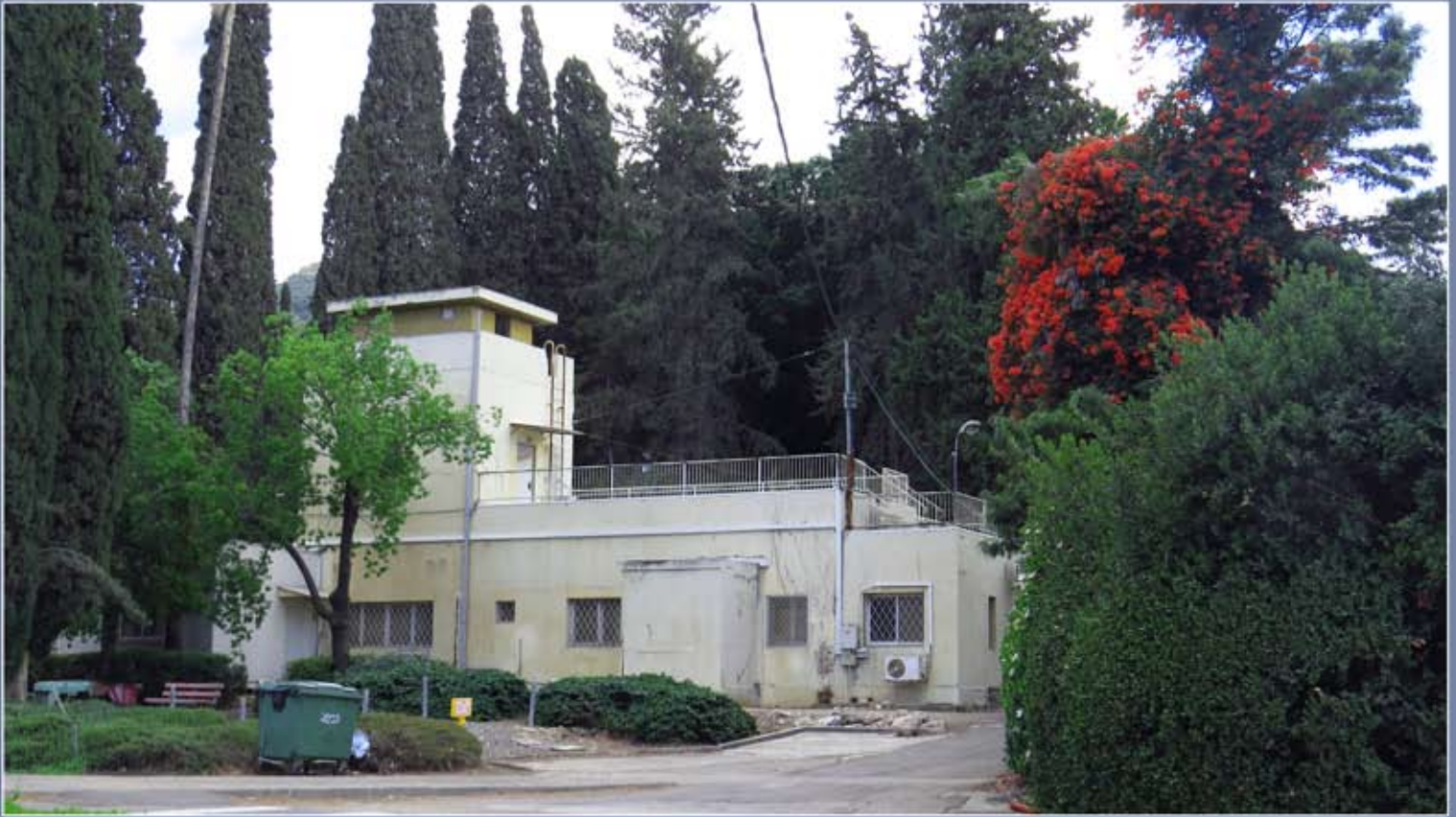
מבנה המשטרה הבריטית