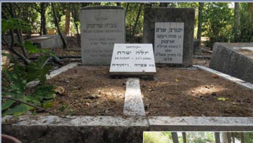
בית הקברות הישן ביגור